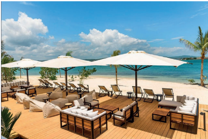
EXCELLENT OYSTER BAY-JAMAICA