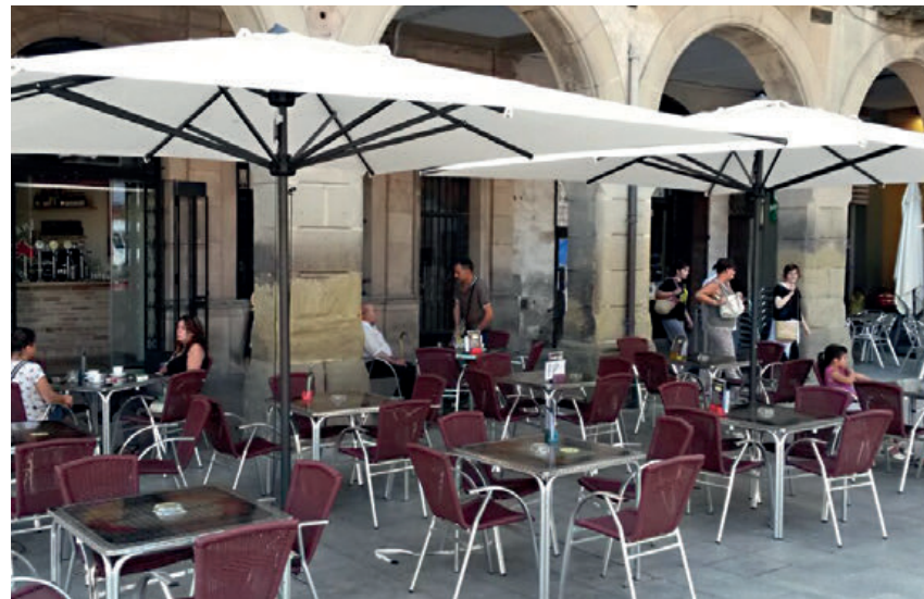
LAGO DI GARDA-ITALY