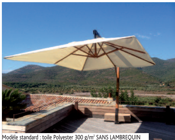
Modèle standard : toile Polyester 300 g/m 2 SANS LAMBREQUIN