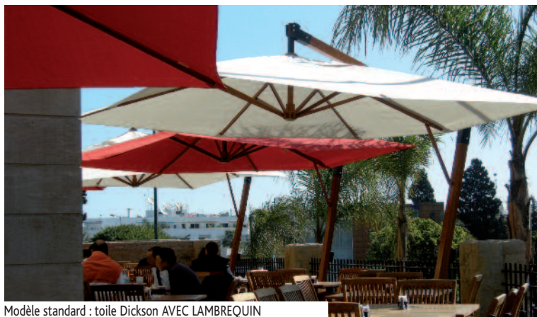
Modèle standard : toile Dickson AVEC LAMBREQUIN